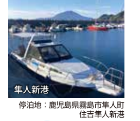
隼人新港 停泊地: 鹿児島県霧島市隼人町住吉隼人新港