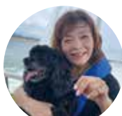
ワンちゃんと一緒に