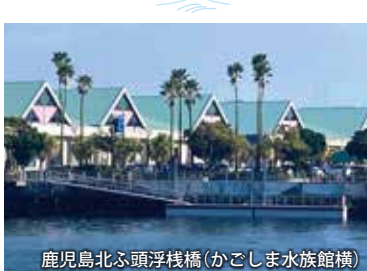
鹿児島北ふ頭浮桟橋(かごしま水族館横)