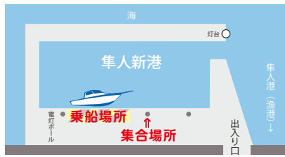
隼人新港内駐車場は駐車禁止場所以外を使用してください。(駐車場無料)