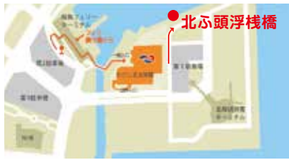
第1駐車場は1時間毎に200円。