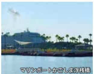
マリンポートかごしま浮桟橋